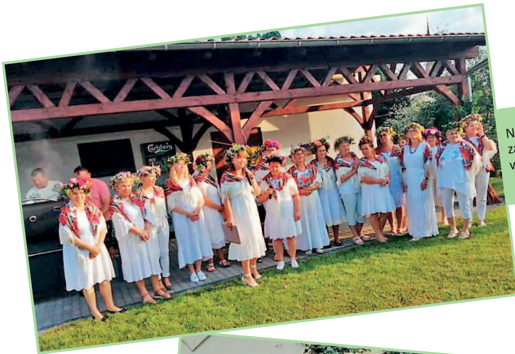
Noc Kupały – plac za remizą strażacką w Brójcach (26.06.2021 r.)