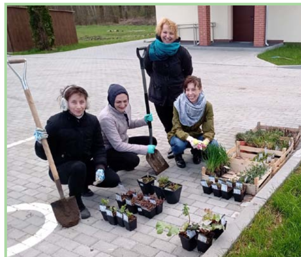
Tworzenie rabaty ziołowej (2021 r.)

nych mieszkańców do udziału w akcji zbierania nakrętek. Wszechstronność inicjatyw podejmowanych przez KGW w Pierzwinie-Kamionce sprawia, że pozytywnie wyróżnia się ono na tle innych organizacji społecznych w regionie. W sierpniu 2021 roku zostało ono wyróżnione statuetką „Lider Trzeciego Sektora Powiatu Zielonogóskiego 2021”.