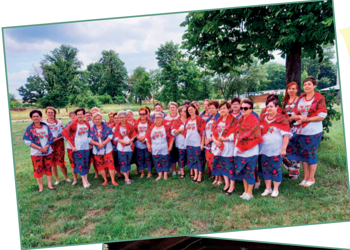
Święto chleba w Chlebowie (2021 r.)