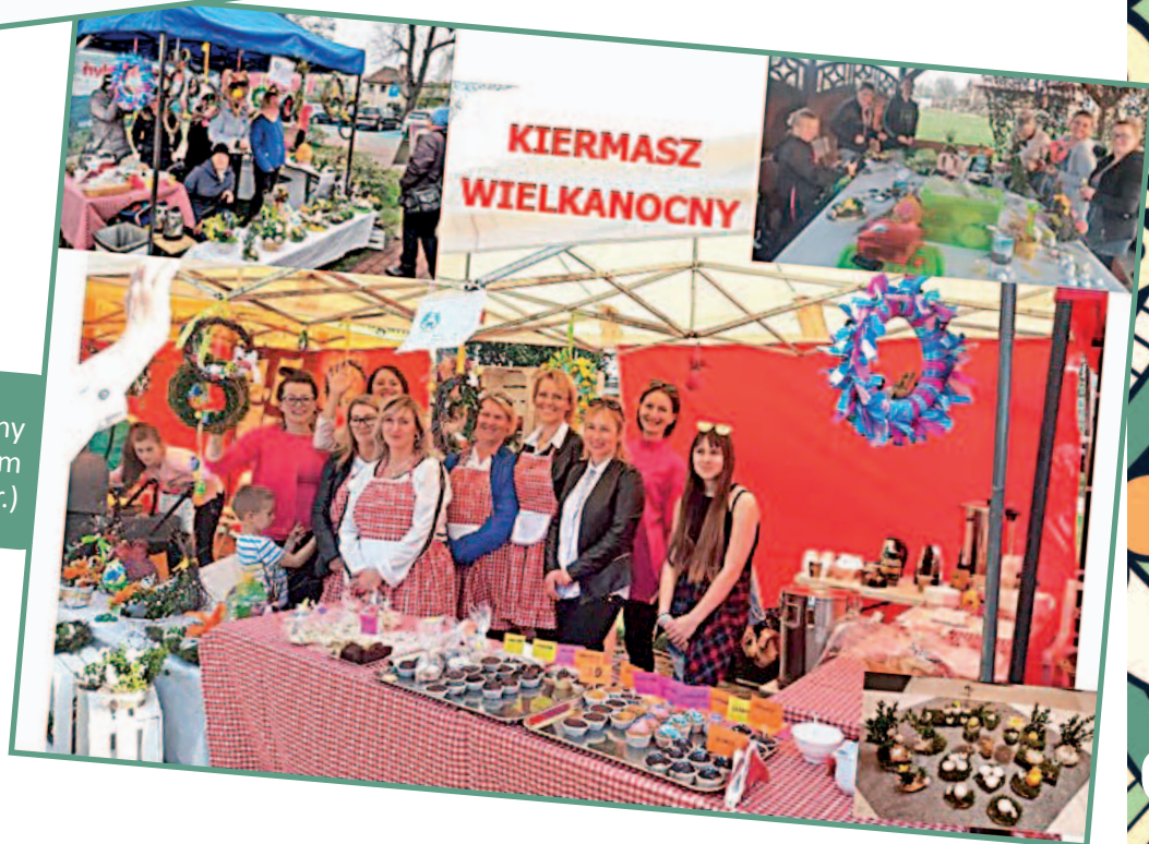
Kiermasz wielkanocny w Pałacu Książęcym (Żagań, 27.04.2019 r.)