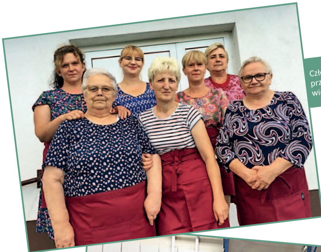
Członkinie Koła przed świetlicą wiejską.