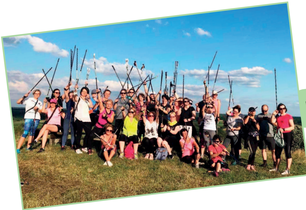
Projekt KGW „Chodzę z kijami” (2020 r.)