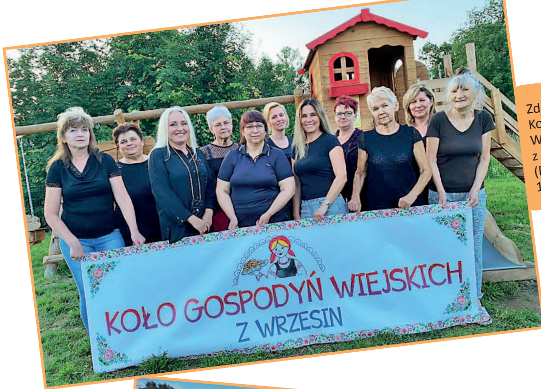
Zdjęcie grupowe Koła Gospodyń Wiejskich z Wrzesin (Plac zabaw, 10.07.2021 r.)