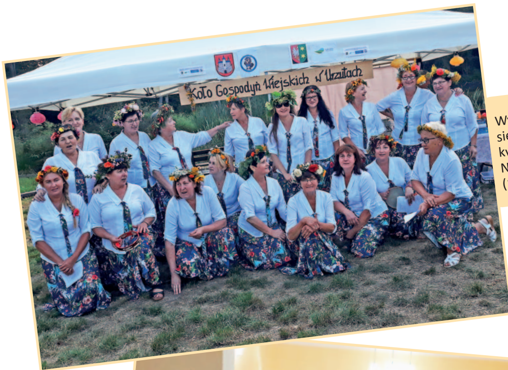
Wydarzenie „Spotkajmy się i poszukajmy kwiaty paproci – Noc Świętojańska” (15.08.2020 r.)