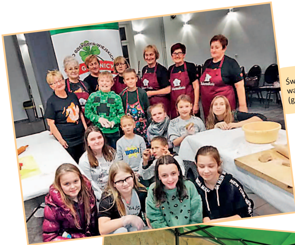
Świąteczne warsztaty kulinarne (grudzień 2019 r.)