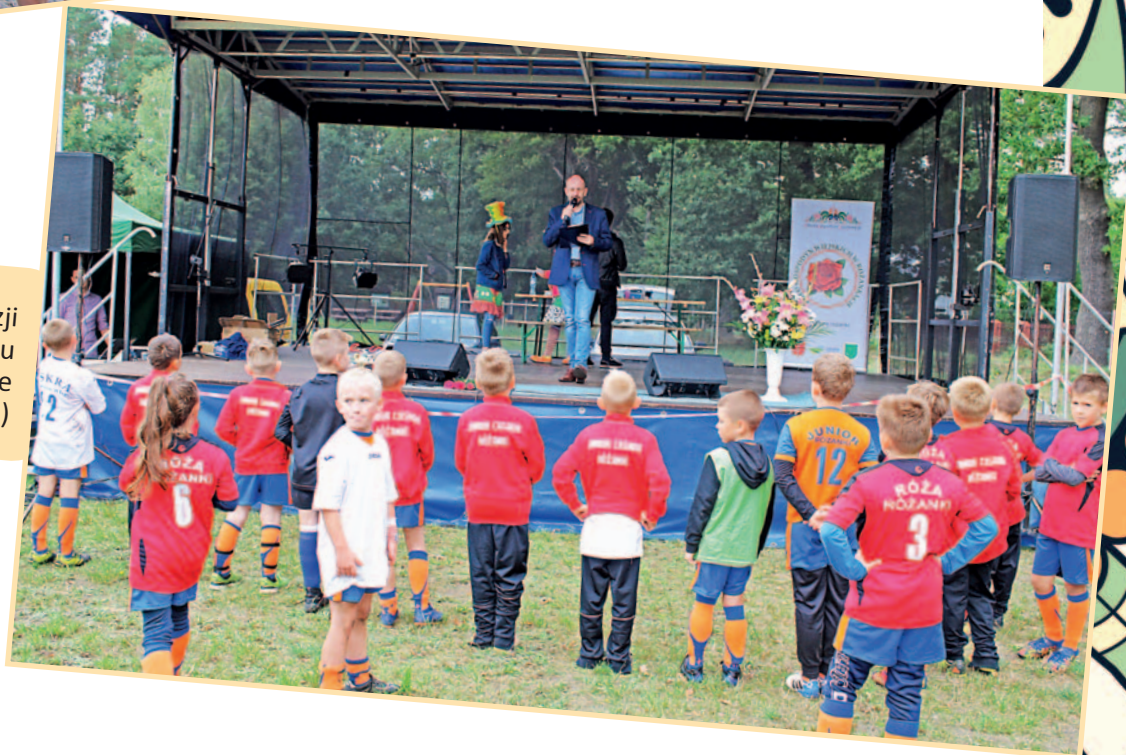
Festyn z okazji 30-lecia samorządu terytorialnego w Polsce (Różanki, 5.09.2020 r.)