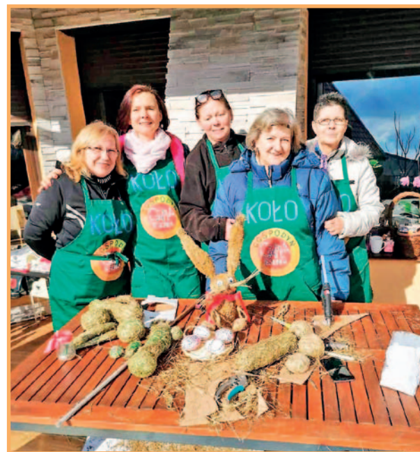
Ręczne wykonywanie zajęć z siana (Wielkanoc 2020 r.)

Z myślą o najmłodszych organizujemy Dzień Dziecka, świątecznego zajęcia i oczywiście Mięsołajki. W okresie pandemii bezinteresownie podjęłyśmy się szycia maseczek dla mieszkańców naszej gminy. Korzystając z uroków naszej okolicy zimą morsujemy a latem zbieramy dary natury.