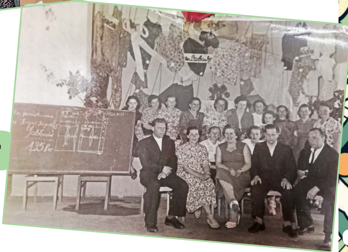
Członkowie koła w 1958 r.