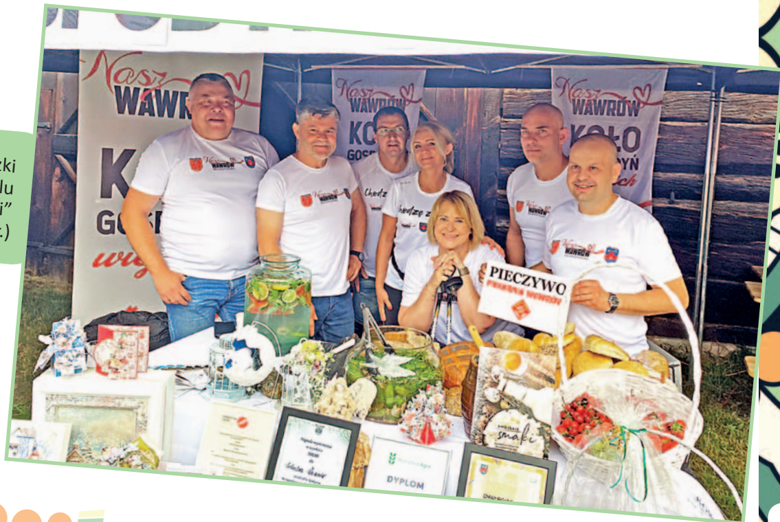
Wojewódzki finał festiwalu „Polska od Kuchni” (Ochla, 26.06.2021 r.)