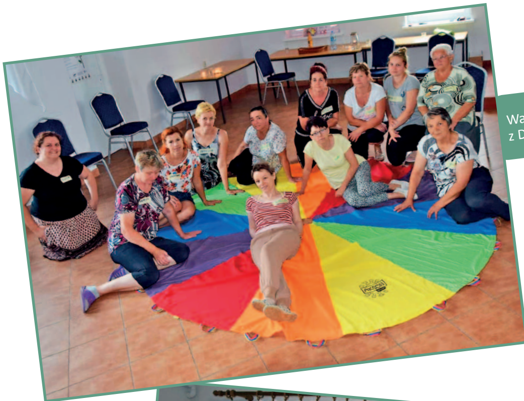
Warsztaty TO NASZ CZAS z Ducatrix (Bełcze).