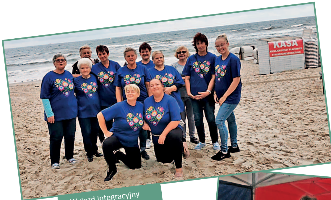
Wyjazd integracyjny w Międzyzdrojach.