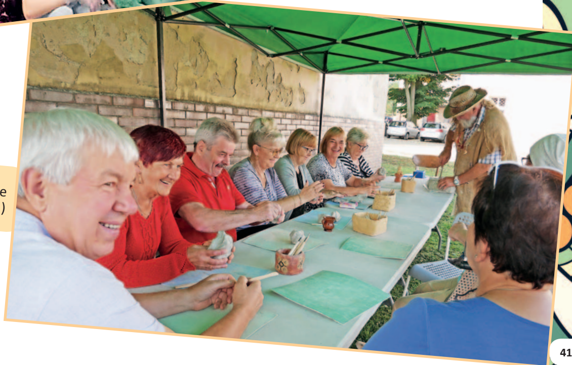
Warsztaty ceramiczne (wrzesień 2020 r.)