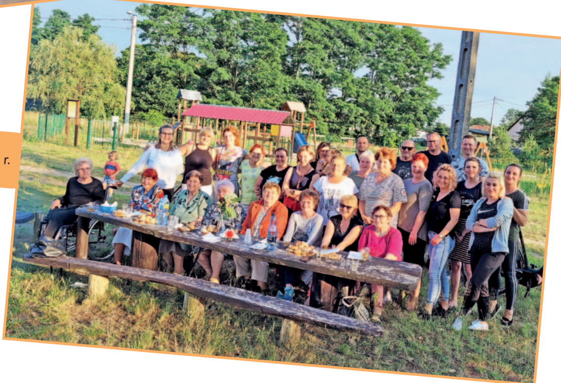
Śliwnik, 2021 r.