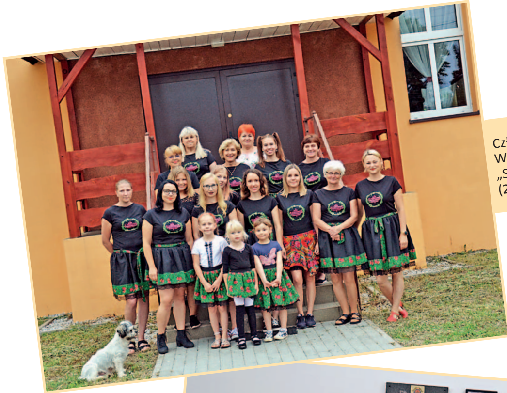
Członkinie Koła Gospodyń Wiejskich w Strzegowie „Strzegowskie Dziouchy” (2021 r.)