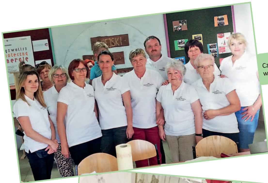
Członkowie koła w 2019 r.