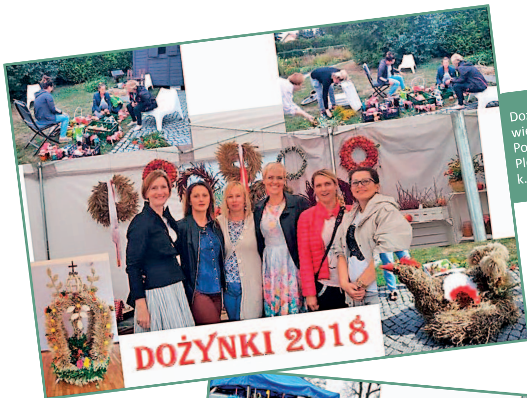
Dożynki - przygotowanie wieńca dożynkowego, Powiatowe Święto Płonów (Tomaszowo k. Żagania, 1.09.2018 r.)