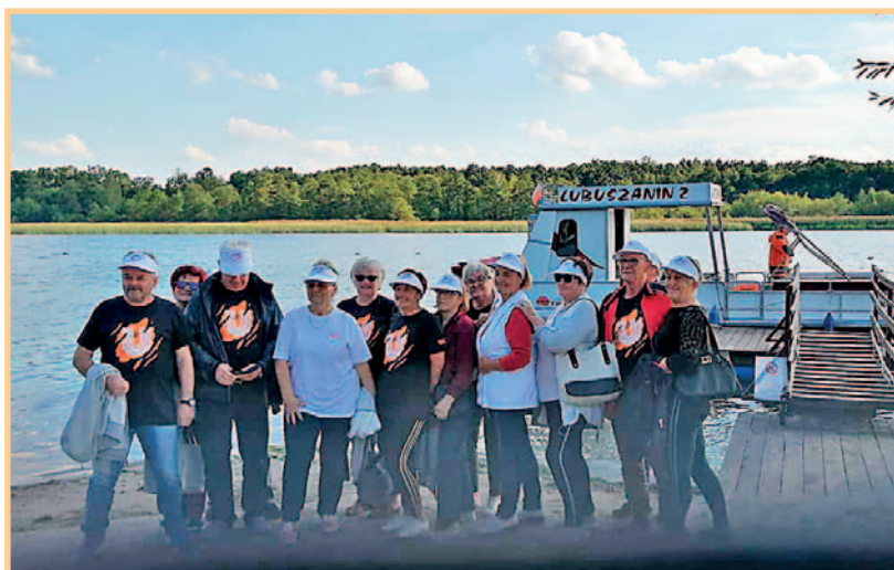
Wyjazd integracyjny nad jezioro Sławskie (wrzesień 2020 r.)

W czasie popandemicznym zainicjowaliśmy już postawienie wielkiego serca na nakrętki oraz pozyskaliśmy środki na odnowienie muralu w centrum naszej miejscowości.