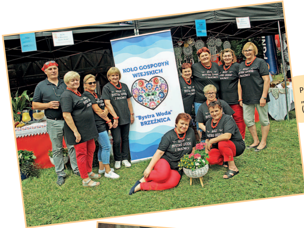
Półfinał festiwalu „Polska od Kuchni” (Ochla, 26.06.2021 r.)