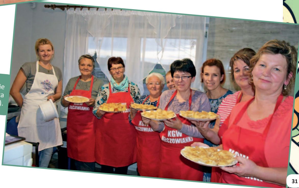
Wspólne gotowanie (świątlica wiejska w Bełczu).