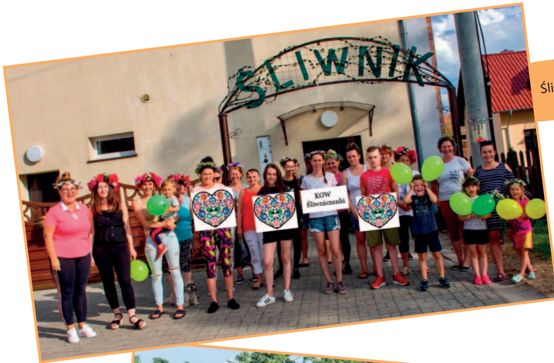
Śliwnik, 2021 r.