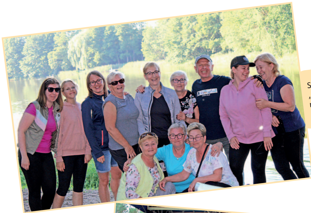
Spotkanie pt. „Bezpieczeństwo nad wodą” (Santoczno, 10.07.2021 r.)