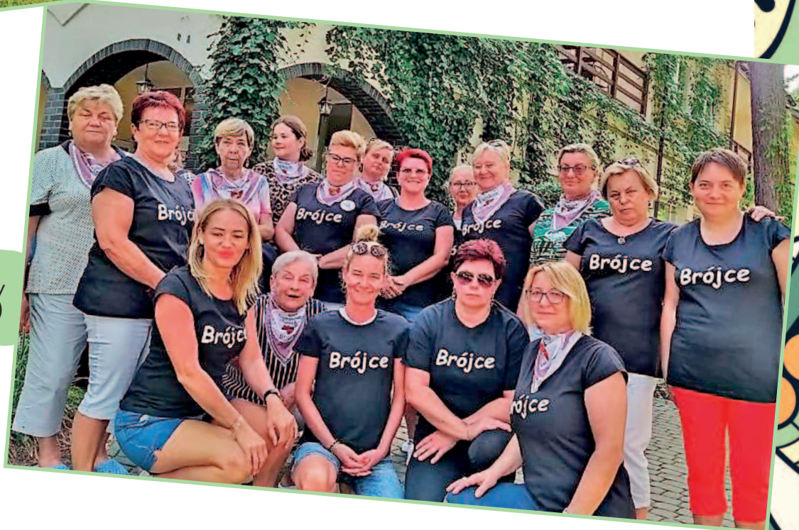
Wyjazd integracyjny (Pogorzelica, 30.08.2020 r.)