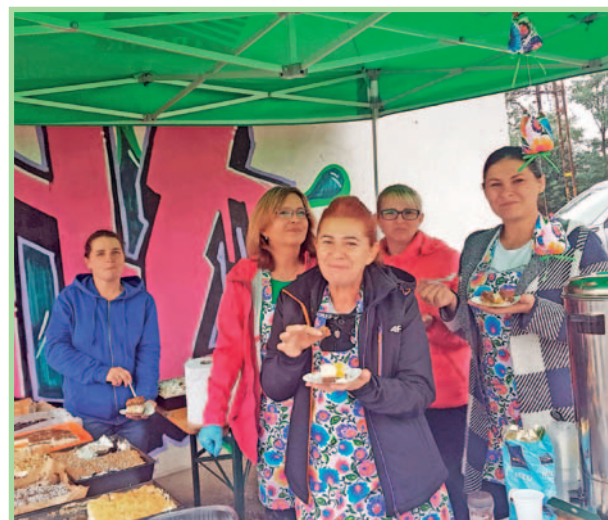
Festyn rodzinny (Niedoradz, 24.10.2019 r.)

Liczne przepisy naszych gospodyń zamieszczyliśmy w regionalnych gazetach oraz w mediach społecznościowych. Współpracując z Radą Sołectką oraz Kołem Łowieckim „Słonka” organizujemy festyny, imprezy okolicznościowe i jubileuszowe między innymi: Dzień Kobiet, Wspólne Śpiewanie Kolęd, Piknik Rodzinny. W przyszłości pragniemy organizować cykliczny festyn promujący naszą miejscowość słynącą z grzybobrania pod nazwą „Grzybobranie z KGW w Niedoradzu”.