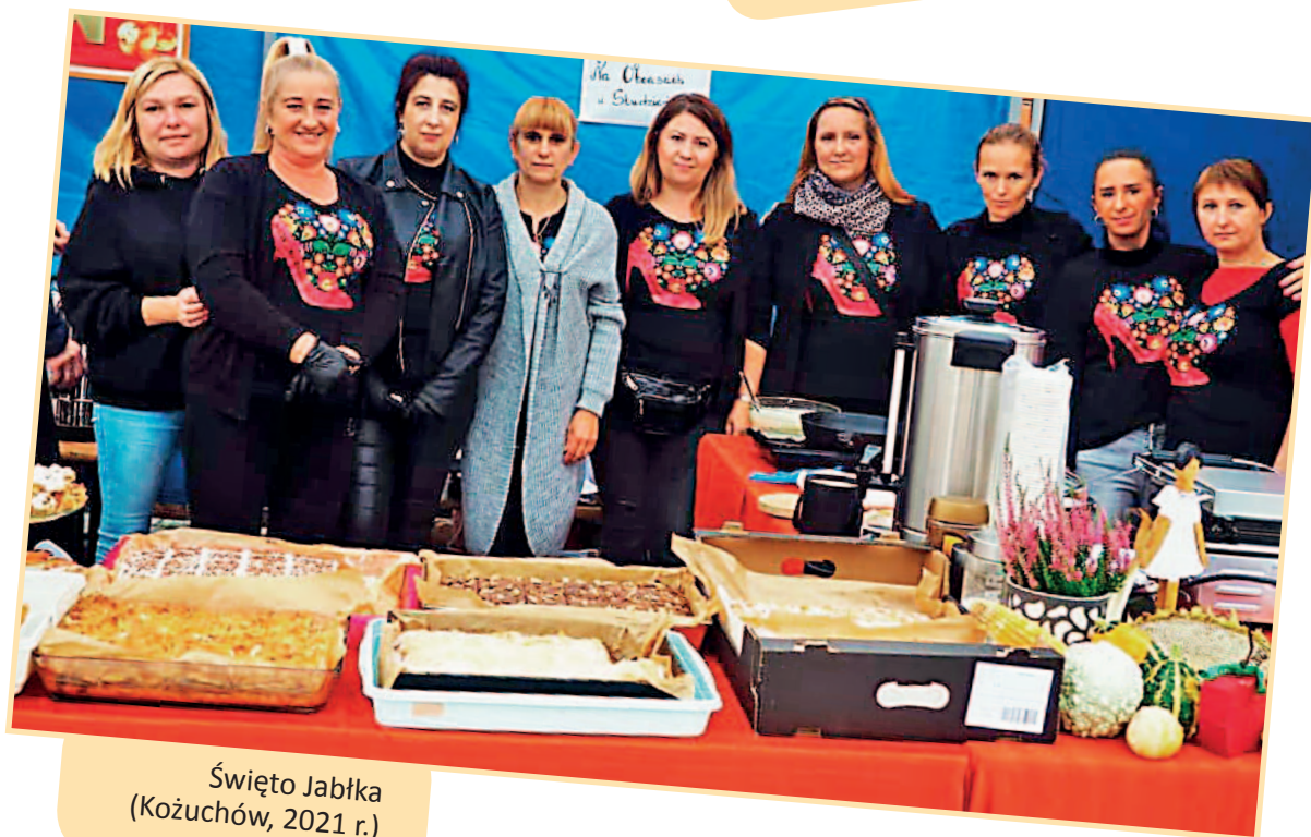
Święto Jabłka (Koźuchów, 2021 r.)