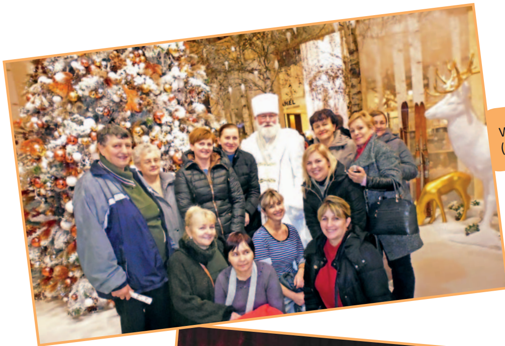
Wycieczka do Berlina (9 grudnia 2014 r.)