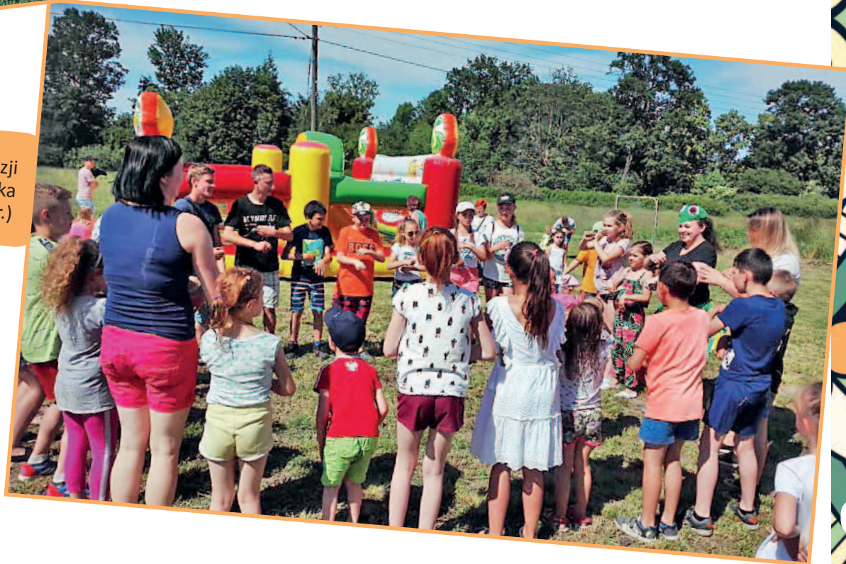
Festyn z okazji Dnia Dziecka (10.06.2019 r.)