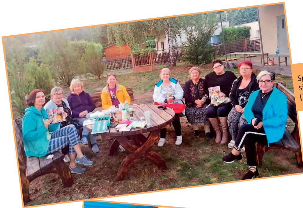
Spotkanie na terenie siedziby naszego Koła (2020 r.)