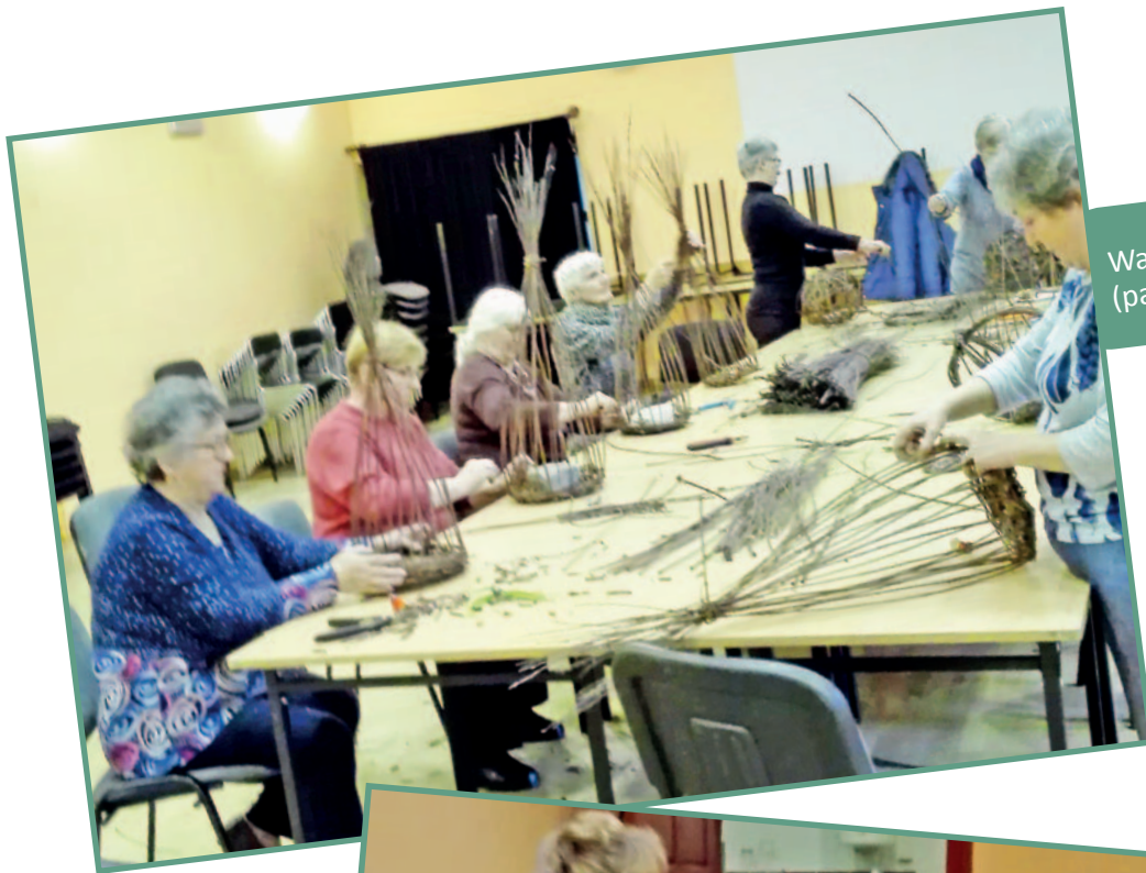
Warsztaty wikliniarskie (październik 2020 r.)