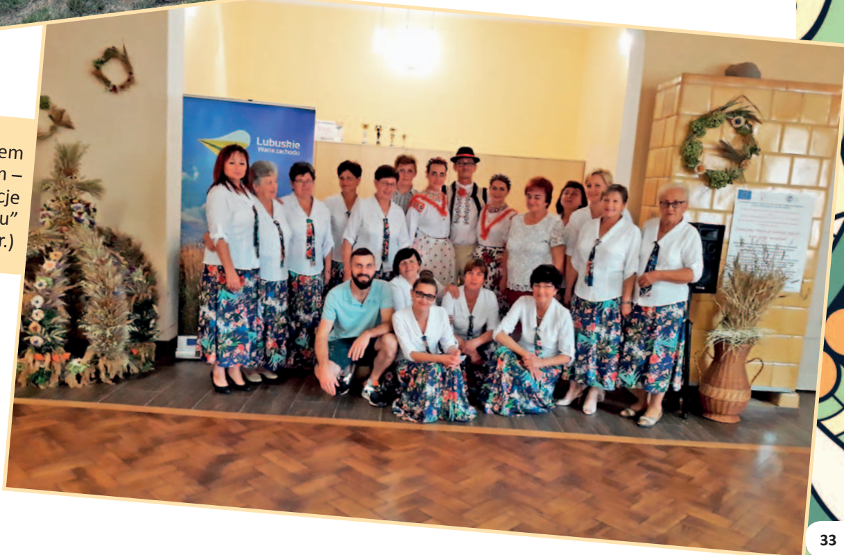
Warsztaty „Wiem gdzie mieszkam – poznamy tradycje naszego regionu” (13.09.2020 r.)