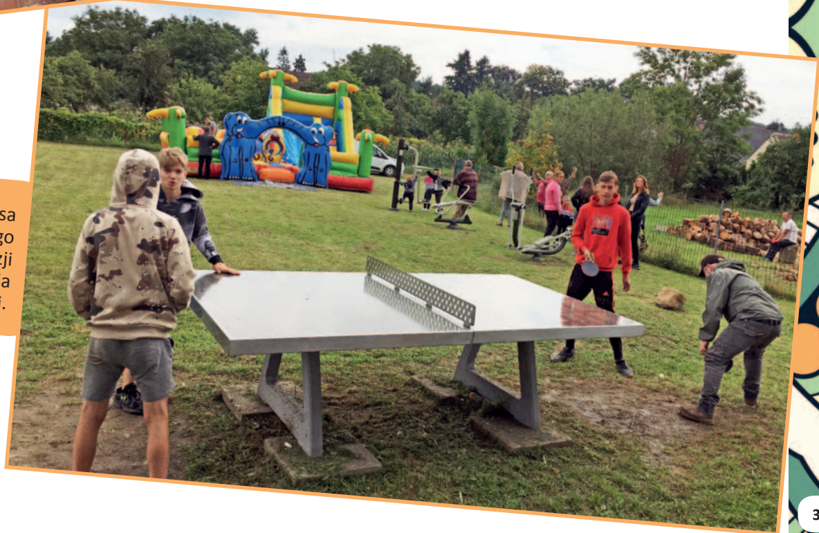
Turniej tenisa stołowego z okazji zakończenia wakacji.