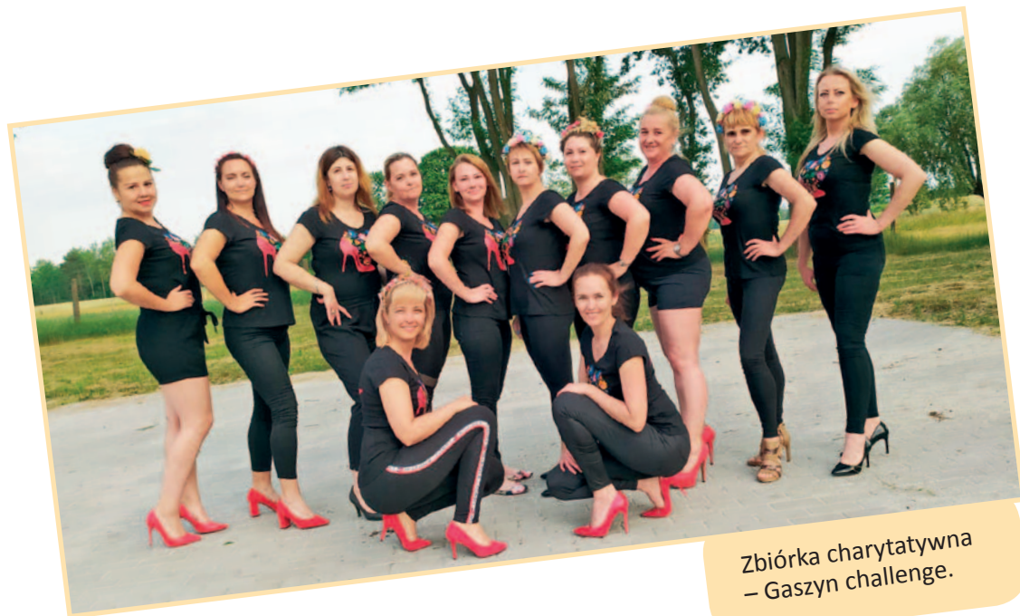
Zbiórka charytatywna – Gaszyn challenge.