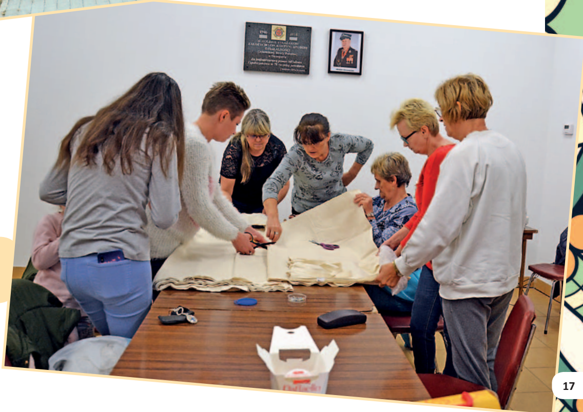
Warsztaty szycia i zdobienia toreb.