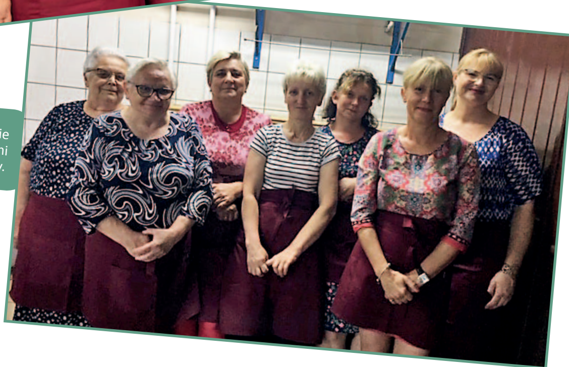
Członkinie Koła w kuchni w świetlicy.