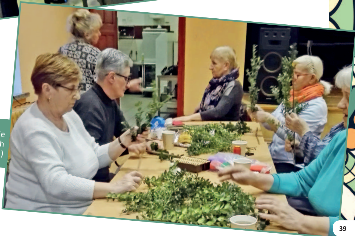
Przygotowanie palm wielkanocnych (kwiecień 2020 r.)