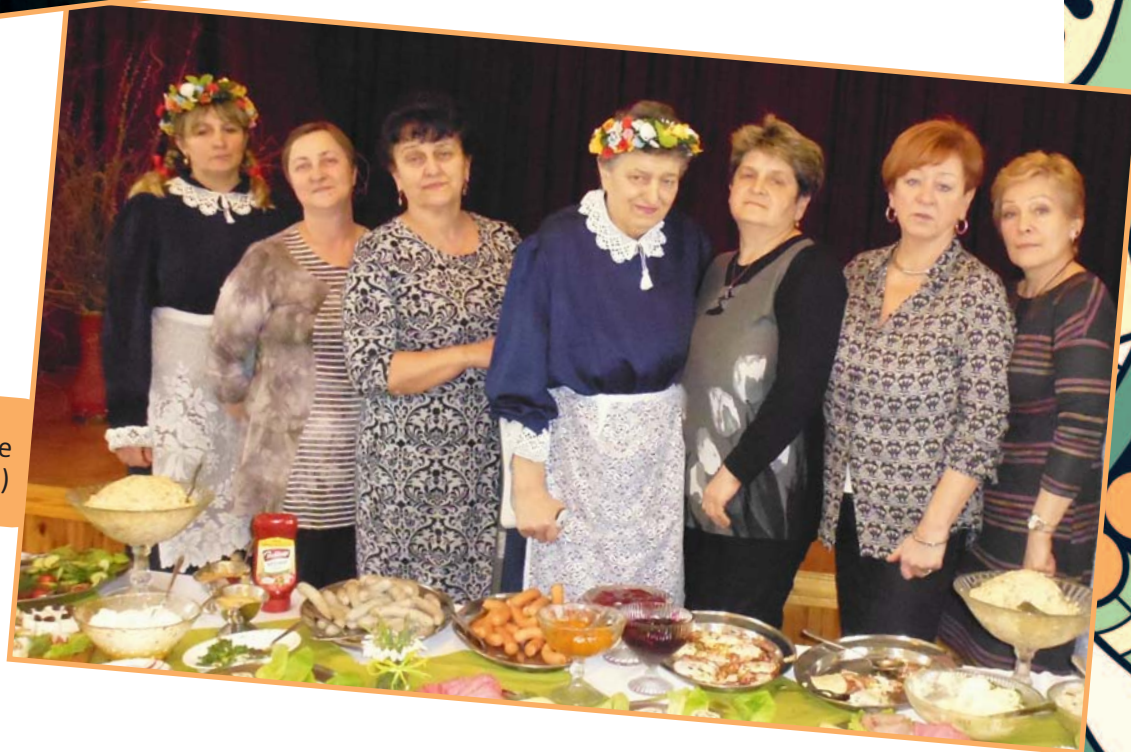
Stoły Wielkanocne (12 marca 2016 r.)