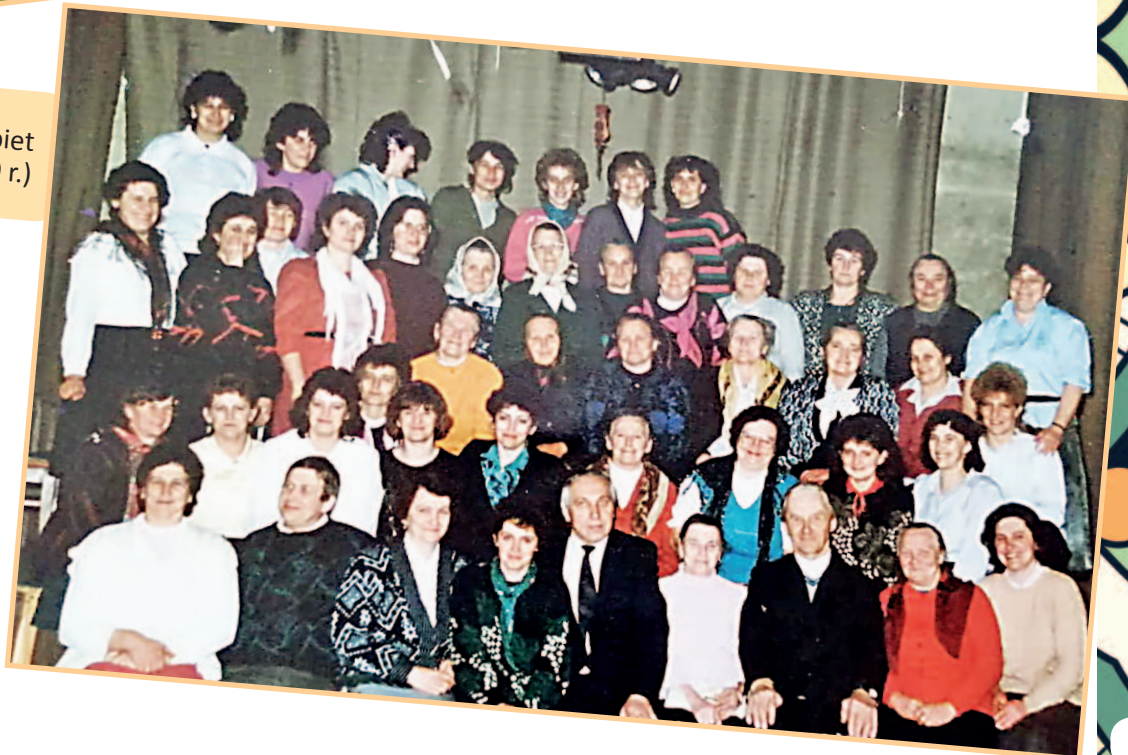
Dzień Kobiet (Brzeźnica, 8.03.1989 r.)