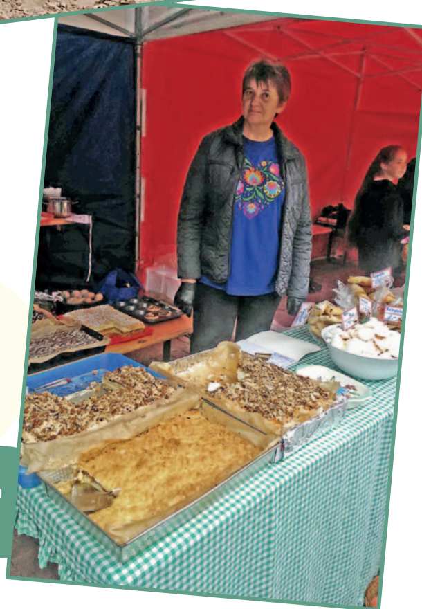
Święto Jabłka (Kozuchów, 2021 r.)