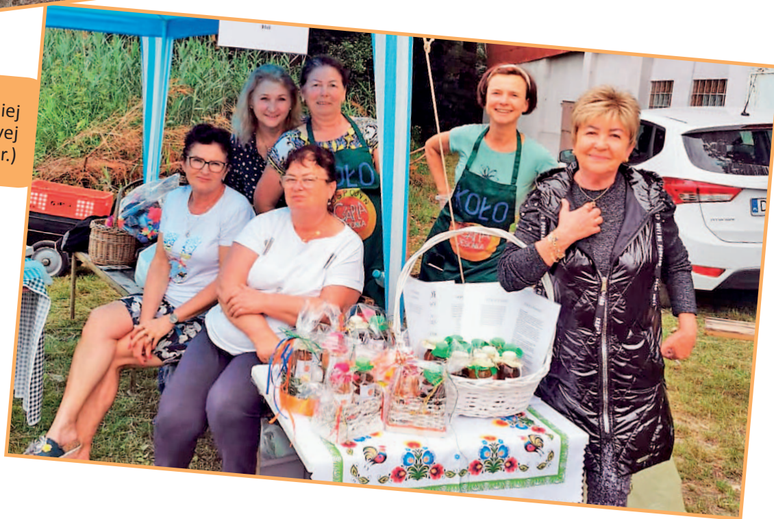
VI Amatorski Turniej Piłki Piżowej (czerwiec 2021 r.)