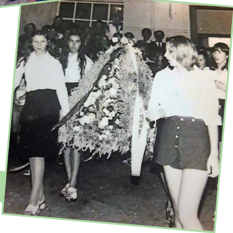
Dożynki, 1975 r.